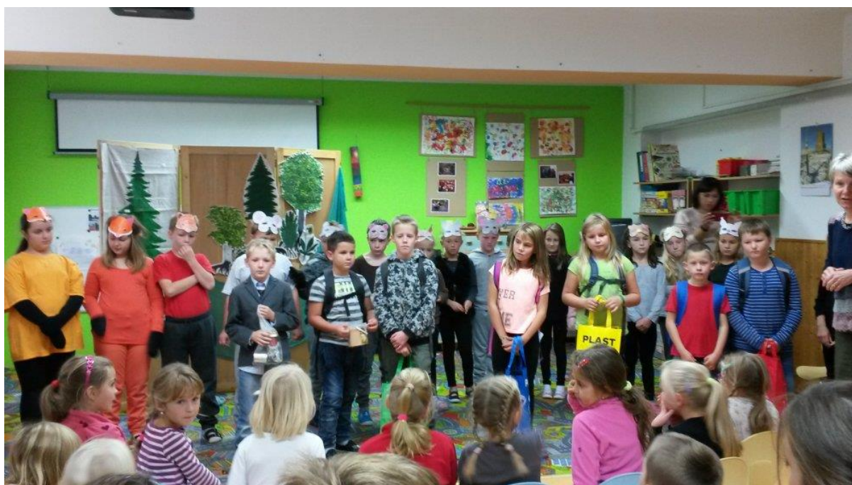
Třetíáci hrají divadlo