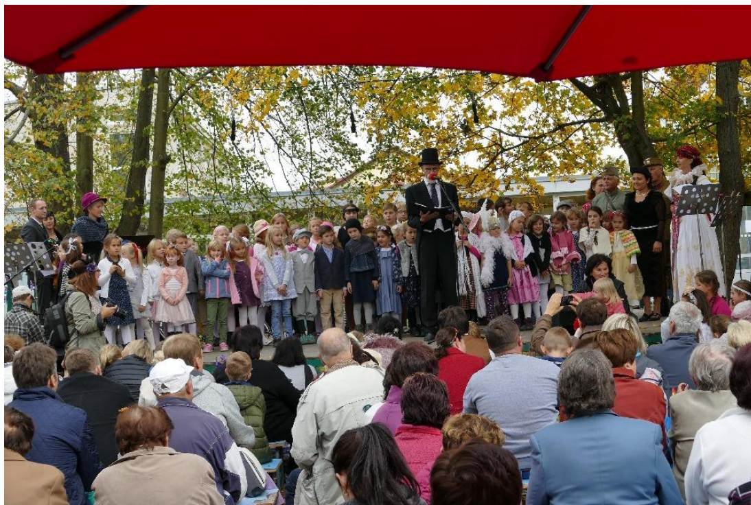
Oslavy 100 let republiky – přijel i Masaryk