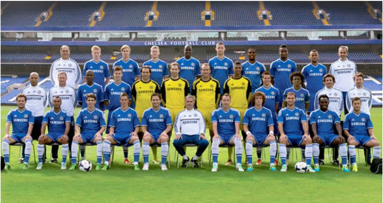
Týmové foto pro sezónu 2013/2014