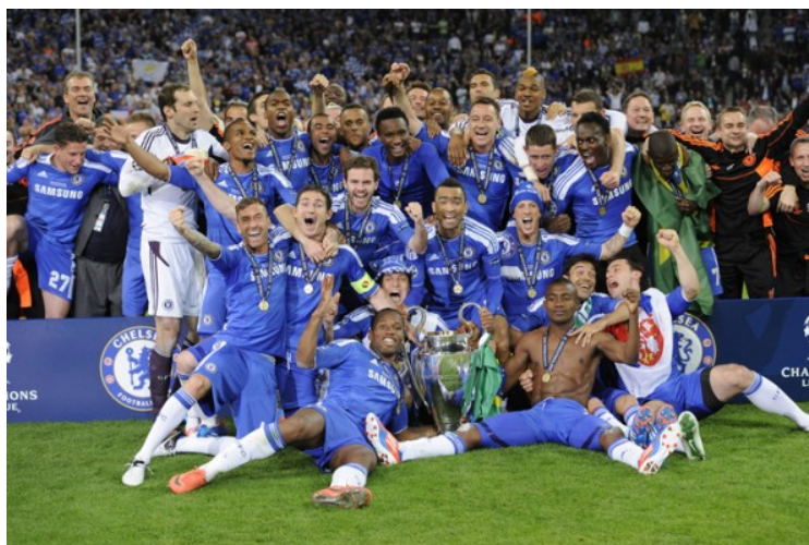
Vítězství v Lize mistrů – sezóna 2011/2012